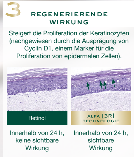
Ergebnisse der morphologischen Analyse nach 24 Stunden

Ein In-vitro-Test an rekonstruierter Haut im Labor mit zwei Formeln auf identischer Basis: eine enthält eine Retinolkonzentration, die typischerweise auf dem Markt verwendet wird, und die andere die Alfa [3R] Technologie, die in den Nuxuriance Ultra Alfa [3R] Gesichts-Pflegeformeln enthalten ist. Diese Informationen sind ausschließlich für die Presse bestimmt. Diese Technologie wurde für alle Hauttypen entwickelt, erfordert keine speziellen Anwendungshinweise und benötigt nicht zwangsläufig Sonnenschutz. Die Produkte sind dermatologisch getestet.